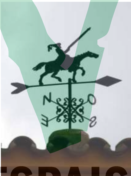
Un Quixot..., a tot arreu n'hi ha.