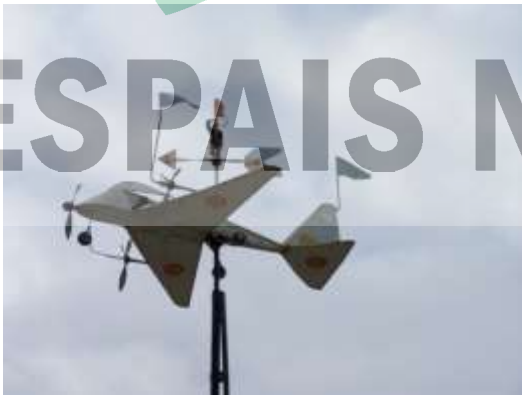
Be, ... què hi farem!