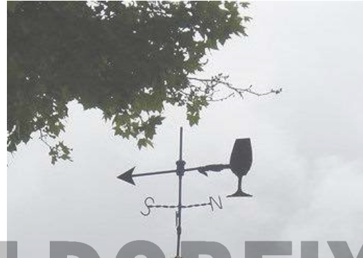
Caseta "La Penúltima" (si, si...)