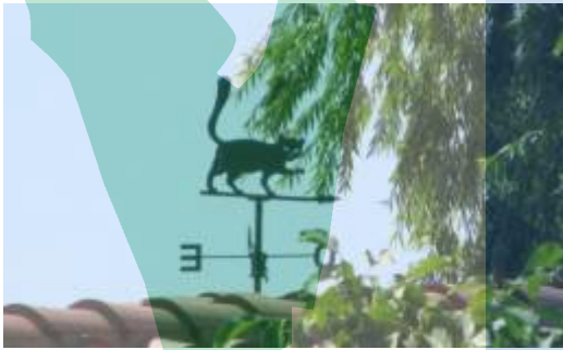
Barri del Mas Roig.