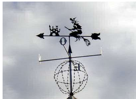
... i mira que d'això!