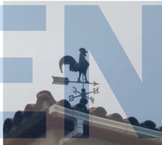
Barri Les Bobines.