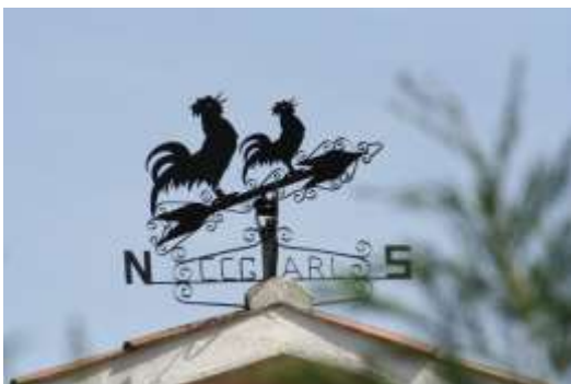
Mirasol, a tocar el barri de la Guinardera.