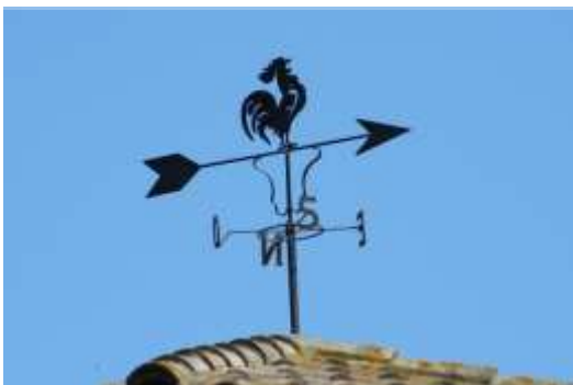
Barri del Mas Fuster.

Presentarem, només, un recull dels diferents tipus trobats, intentant que sigui el més variat possible i representatiu del que oneja a sobre les nostres teulades.