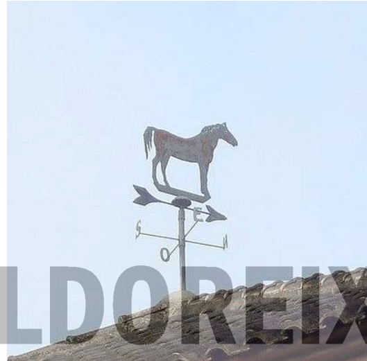
Barri de Les Bobines.