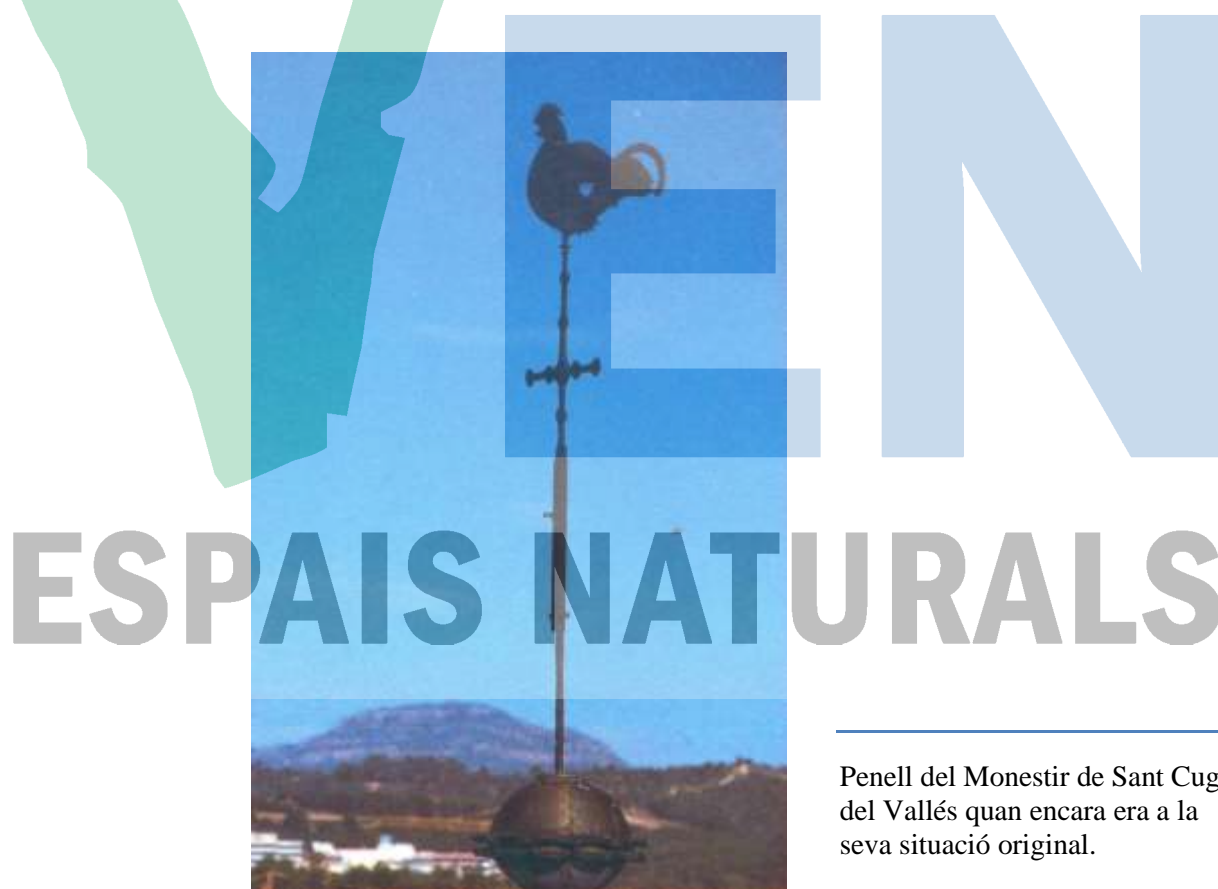
Penell del Monestir de Sant Cugat del Vallés quan encara era a la seva situació original.