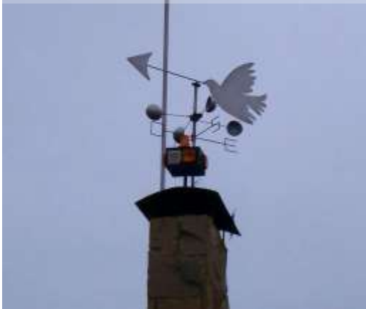
Barri Ca N'Enric la Miranda.