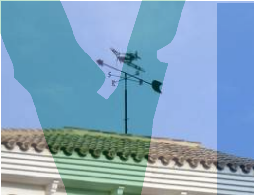
Tot un caça de la II Guerra Mundial.