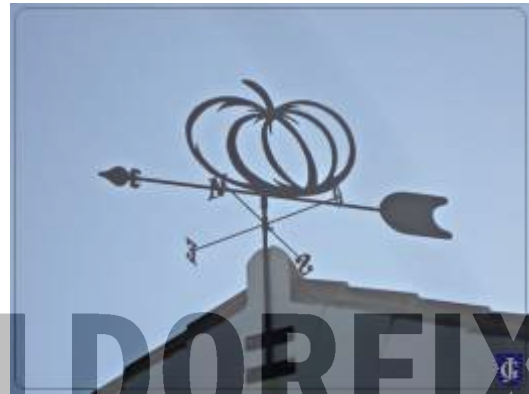
¡¡¡Aquí hay tomate!!!