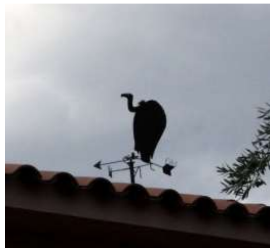
Barri de Can Cadena.