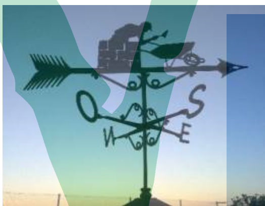
Un del gremi de la construcció.