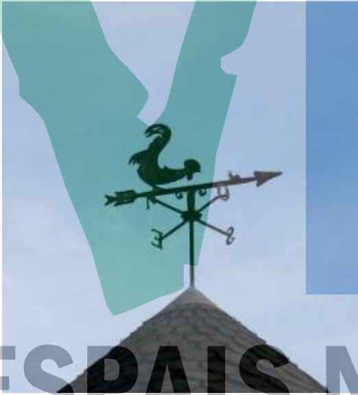
Gall i victima (Barri del Mas Roig).