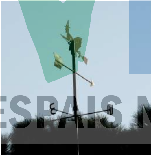
La Floresta (Foto J. M a Fe, AVVCELM).