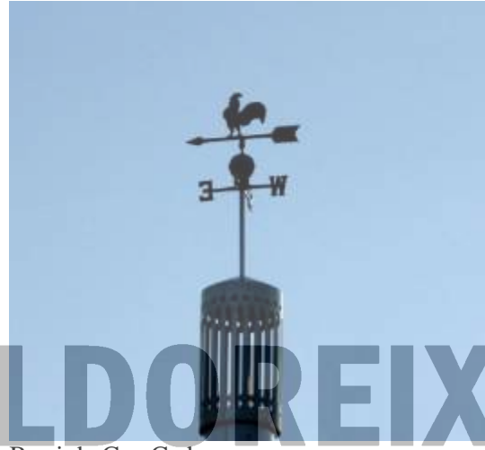
Barri de Can Cadena.