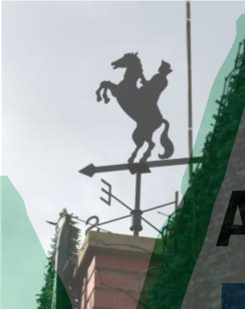
La Floresta, a tocar al Barri de Sant Jaume.