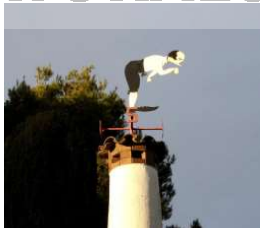
Barri del Rossinyol.