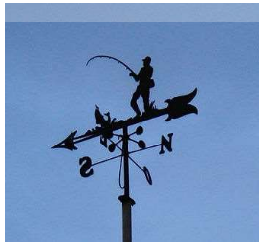
i pescador, pescant (exagerant com sempre!)