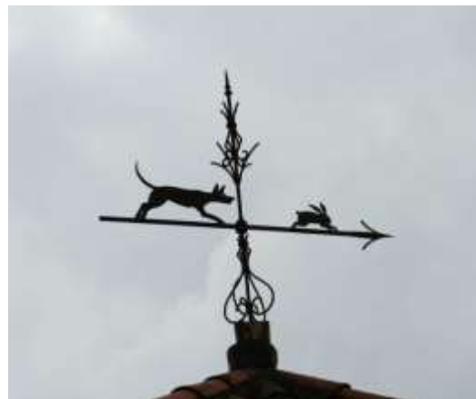
Barri del Rossinyol.