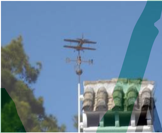
Un del Barón Rojo .