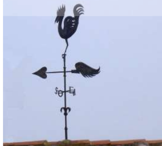
Barri del Regadiu.