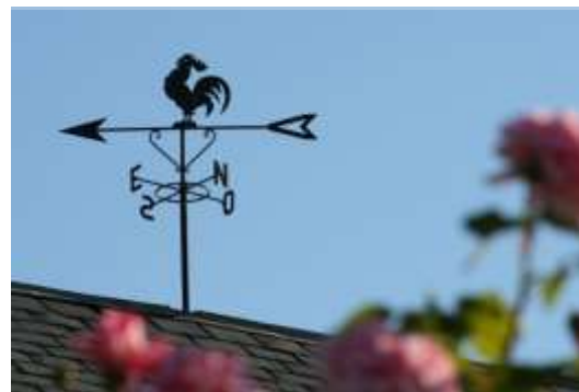
Barri de Can Cadena.