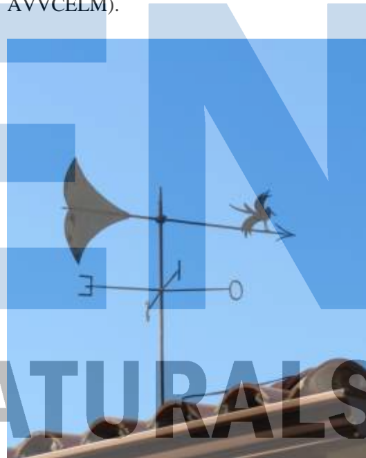
Barri de Mas Fuster.