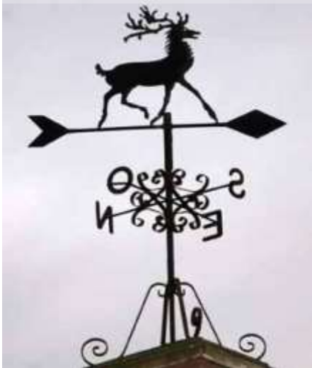
Sense comentaris (valga'm Déu!).