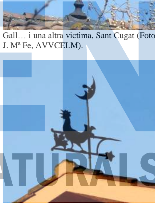
Barri del Monmany.