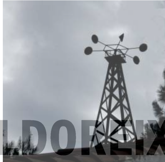
Barri Colònia Montserrat (Foto J. M a Fe, AVVCELM).