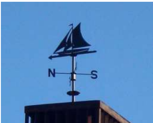
Mirasol, a tocar al Barri de Can Cadena.