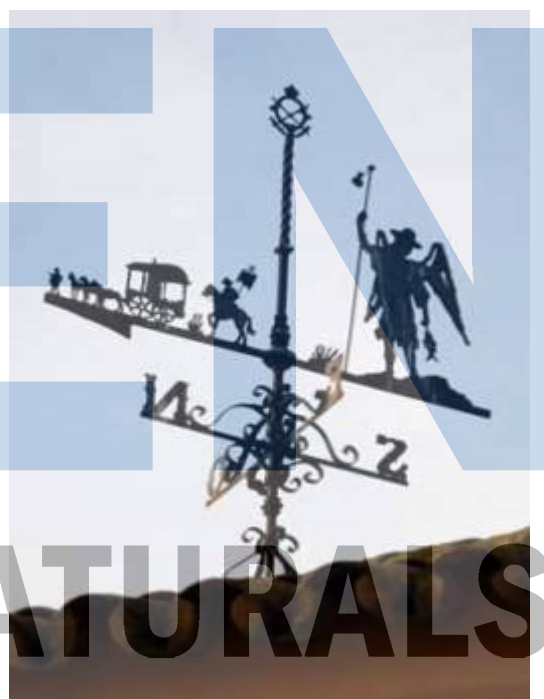
Un de peregrins: el camí de Sant Jaume.