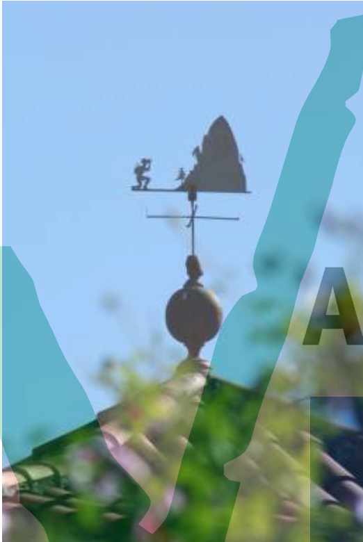
Mirasol, a tocar al Barri de La Guinardera.