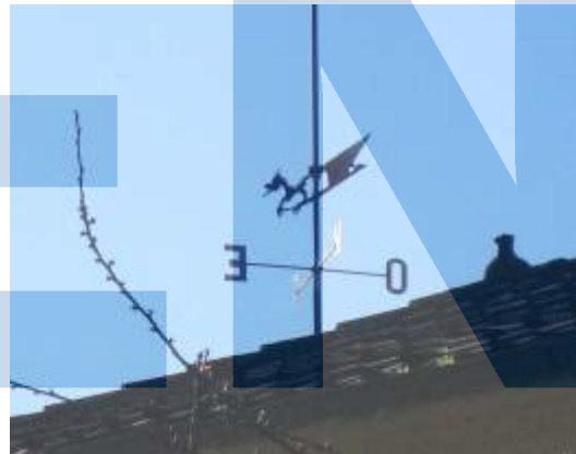
Barri d'Aqualonga (Foto J. M a Fe, AVVCELM).