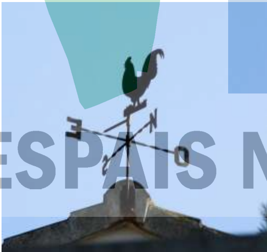
Barri de Can Cadena.