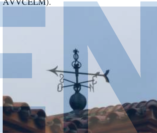
Barri del Monmany