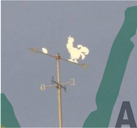
Gall o gallina? Barri del Rossinyol (Foto J. M a Fe, AVVCELM).