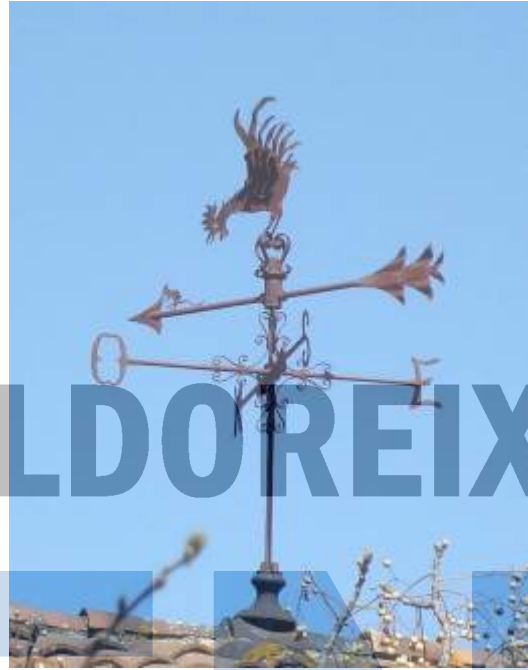
Gall... i una altra victima, Sant Cugat.