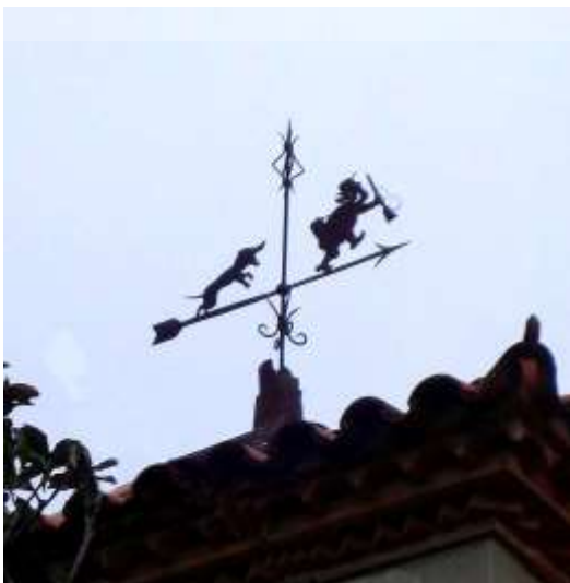
Barri de Can Cadena.