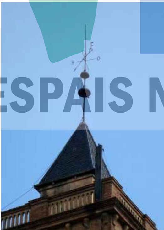
Penell-parallamps de Can Monmany..