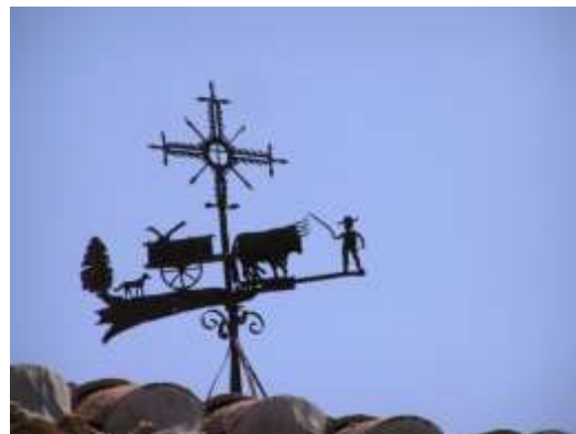
Un camperol "galleguiño" de 150 anys d'antiguitat.