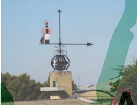
González Byass: la més gran del món (Record Guinness).