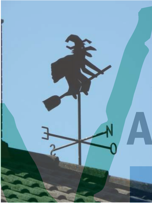
Barri del Rossinyol.