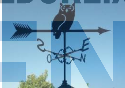
D'això també n'hi ha a tot arreu.